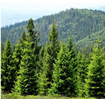
1. Хвойный лес

Задание 12. Отметьте кружком лес, который горит быстрее.