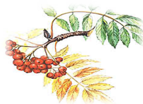
4. Плоды рябины