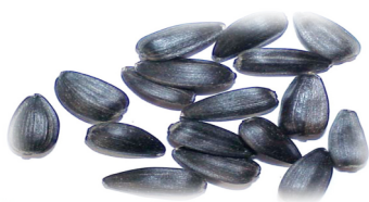
3. Семена подсолнуха