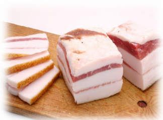
1. Несоленное сало

Задание 6. Что можно положить в кормушку для подкормки зимующих птиц? Обведи кружком цифру с названием корма.